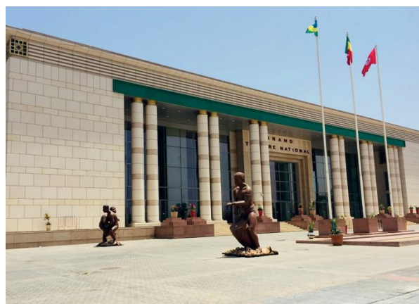
グラン・テアトル国立劇場